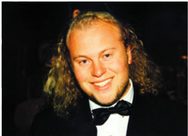
SISTE ÅR MED HÅR: – Dette var i 1994. Da var jeg programleder i Videoøyet på NRK. Jeg begynte å miste hår allerede da, men i motset- ning til mange andre gutter, bryr jeg meg ikke ett døyt om akkurat det. Gutter uten hår har mer testosteron har jeg hørt. Så det.