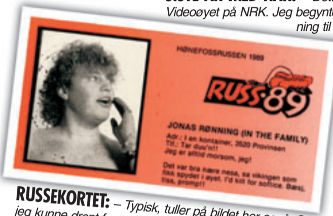
RUSSEKORTET: – Typisk, tuller på bildet her også. Se, jeg kunne drept for softis, står det. Hvis du slutter med søtsaker, vil du ikke bli lykkelig, sa en kompis til meg en gang.

”Egentlig har jeg ikke hatt meg nok til å fortjene og få barn ennå.