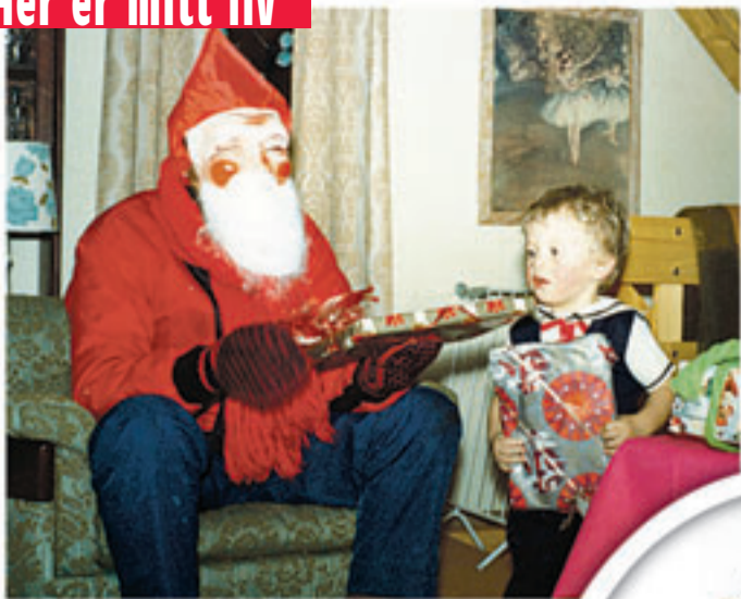
SJEKK DE ØYNENE: – Dette var vel jula i 1972 på Hosle i Bærum. Jeg aner ikke hvem som var nissen, det kan ha vært en nabo, men jeg var uansett mest opptatt av gavene.