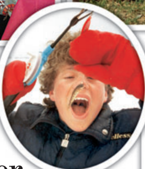
GLADSILD: – Her har jeg fått en bitte liten røye, eller noe, på hytta til en venninne av mamma i Ål. Jeg er ingen fisker, men jeg spiser masse fisk.